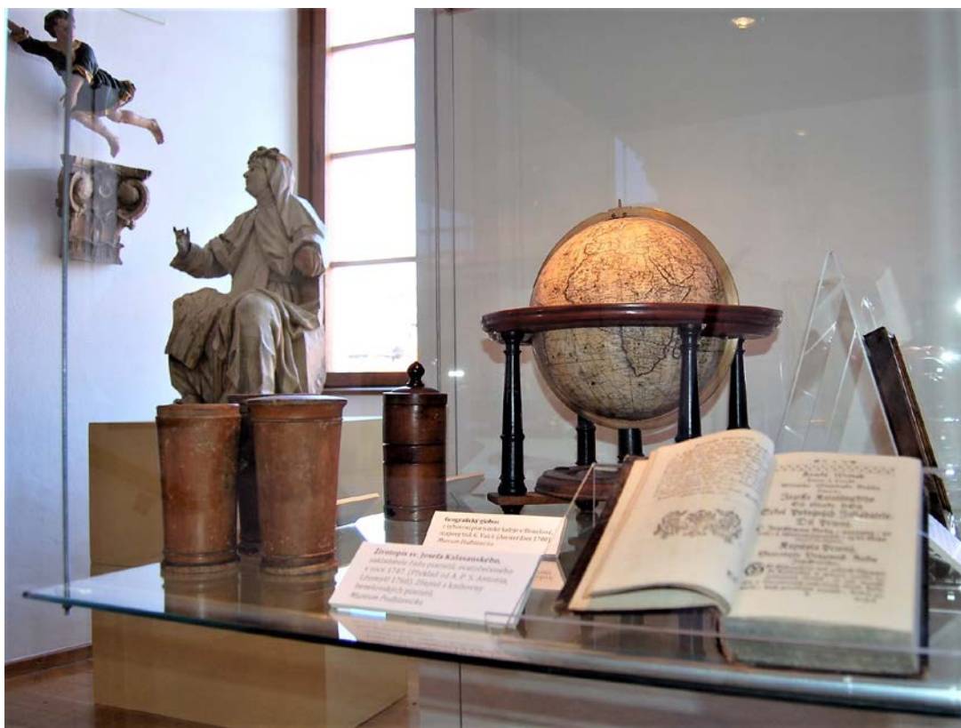
Obr. 11 Instalace výstavy Za vlády Marie Terezie ve vlašimském zámku