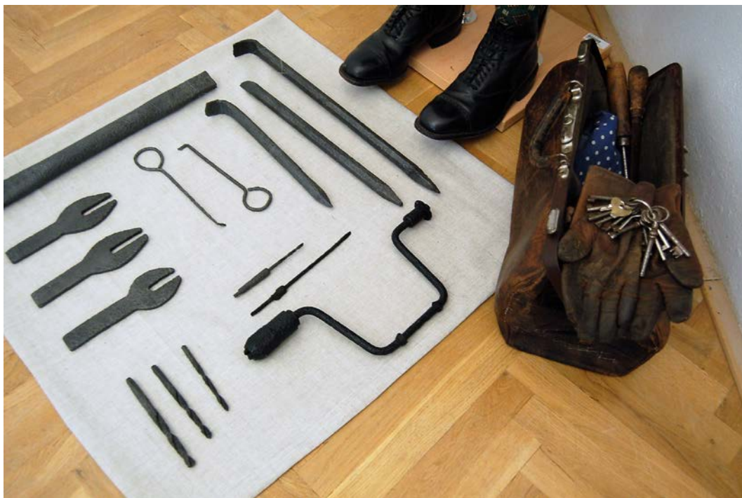
Obr. 14 Presentace zajímavého archeologického nálezů kasařského náčiní v rámci výstavy Napříč staletími. Archeologické novinky v Muzeu Podblanicka v benešovské pobočce muzea