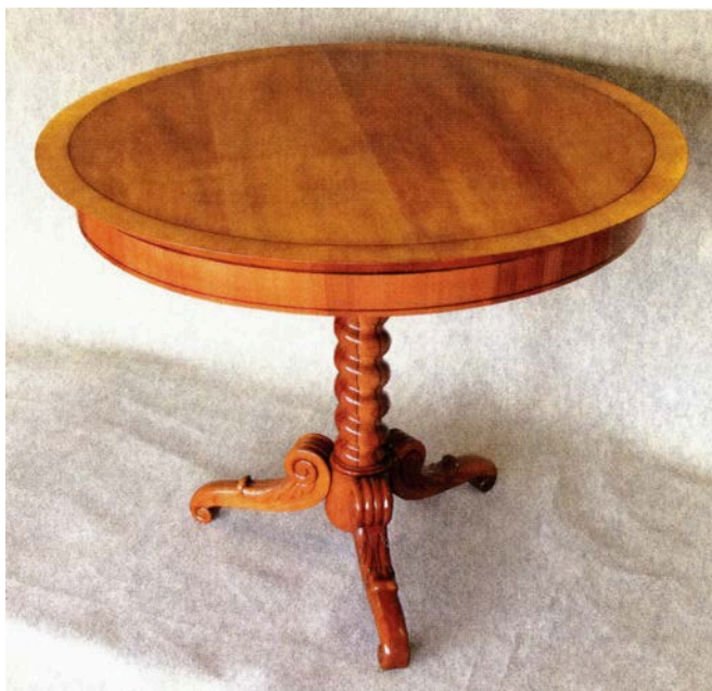
Obr. 5 Dřevěný stůl s tordovanou nohou ze sbírek muzea zrestaurovaný v roce 2017