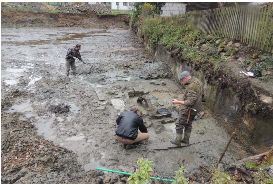
Obr. 23 Záchraný archeologický výzkum v lokalitě Bělčice u Ostředka