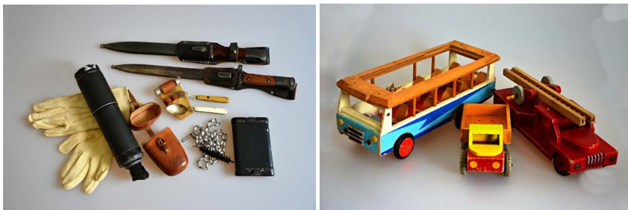
Obr. 1-2 Mezi předměty získané darem do sbírkového fondu muzea v roce 2017 patří například součásti vojenské a policejní výzbroje a výstroje z počátku 20. století nebo dřevěné hračky z druhé poloviny 20. století

Rozšíření sbírkového fondu muzea proběhlo především prostřednictvím nákupů, zápisu nálezů získaných v rámci záchranné archeologické činnosti a prostřednictvím darů do muzejních sbírek. Z celkového počtu nově získaných přírůstků připadlo 141 položek na dary, které věnovalo muzeu celkem 11 dárců.