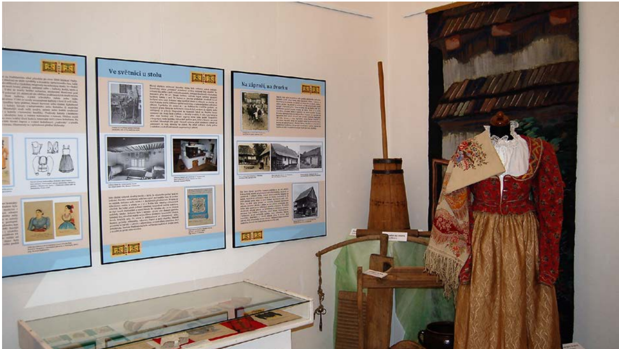
Obr. 12 Instalace etnografické výstavy V chalupách pod Blaníkem v benešovské pobočce