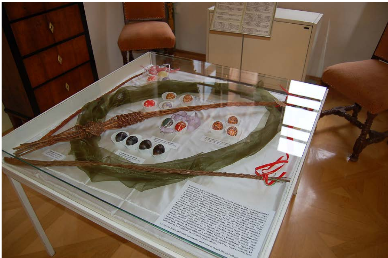
Obr. 13 Instalace výstavy Velikonoční vajíčka v zámku ve Vlašimi