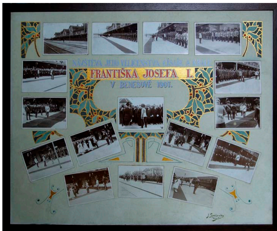
Obr. 6 Fotografické tablo z návštěvy jeho veličenstva císaře a krále Františka Josefa I. v Benešově v roce 1907, zrestaurované v roce 2017 (foto Muzeum Podblanicka, p. o.)