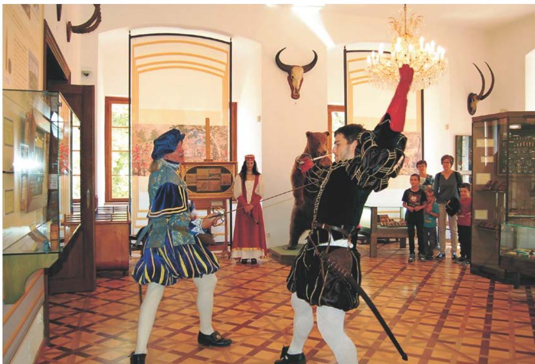
Obr. 15 V rámci Dnů evropského kulturního dědictví mohli být návštěvníci svědky šermířských vystoupení přímo v muzejních expozicích ve vlašimském zámku