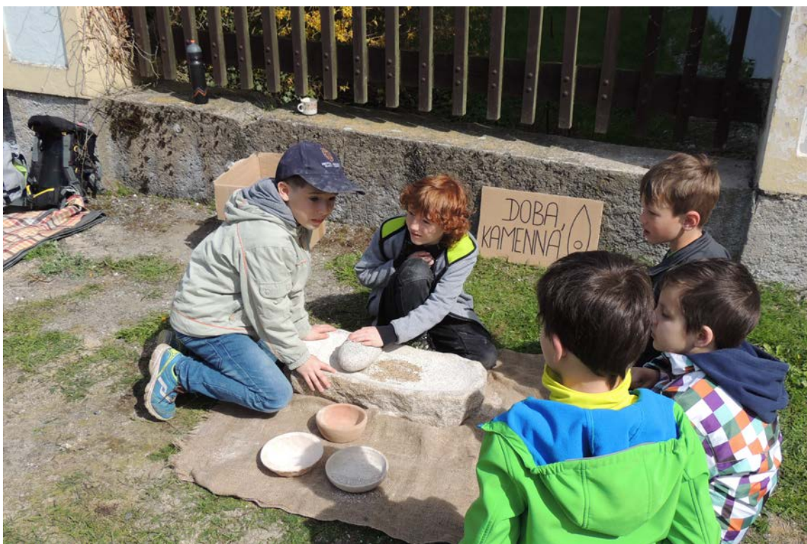
Obr. 16 V areálu zámku Růžkovy Lhotice jsou pro školy pořádány oblíbené edukační programy zaměřené na archeologii a nejstarší dějiny

Pravidelně jsou mezi kulturně výchovnými akcemi muzea zastoupeny přednášky a edukační programy. V roce 2017 jich muzeum uspořádalo celkem 48. V rámci přednáškového cyklu muzea vystoupila v 9 přednáškách ve vlašimském zámku řada odborníků, kteří seznámili posluchače s nejnovějšími poznatky v rámci svých oborů. Zajímavé přednášky byly organizovány také v rámci projektu Benešov technický a industriální (viz Příloha č. 2). Další edukační aktivitou muzea, která má již své tradiční místo v jeho programu, byly koncerty pro žáky mateřských a základních škol, v jejichž rámci je hravou formou přibližován svět tzv. vážné hudby nejmenším posluchačům.