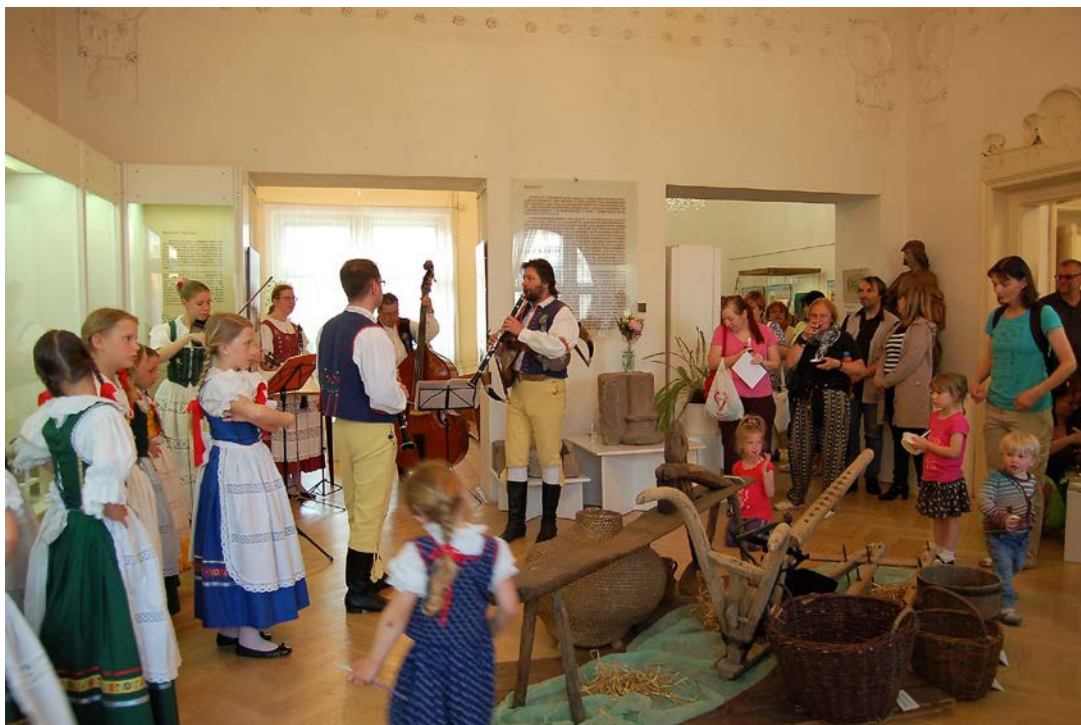
Obr. 17 Program muzejní noci v pobočce muzea v Benešově byl pestrý