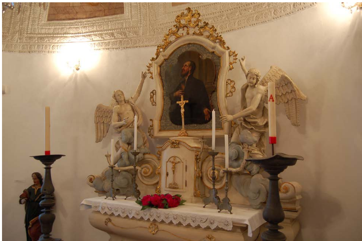
Obr. 9 Součástí muzejních prohlídkových tras ve vlašimském zámku je i kaple sv. Vincence

zámku připomeňme například výstavu obrazů malíře Jana Dvořáka, kabinetní výstavu Velikonoční vajíčka či několik výstavy fotografií. Vánoční výstava ve vlašimském zámku byla věnována drátenickému řemeslu.