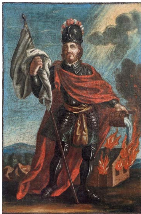
Obr. 3-4 Dřevěná polychromovaná plastika Krista z 2. poloviny 16. stol. a obraz sv. Floriána z konce 18. stol. patří mezi předměty ze sbírek muzea zrestaurované v roce 2017