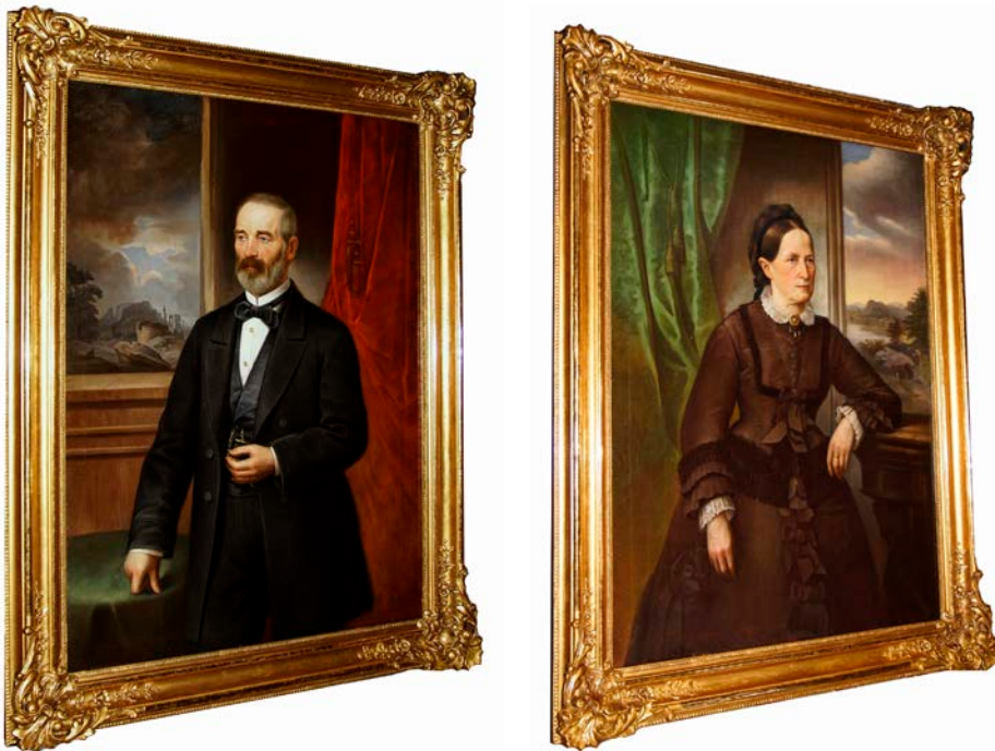
Obr. 7-8 Na restaurování dvou velkých portrétních obrazů v ozdobných rámech z konce 19. stol., které pochází z majetku vlašimské měšťanské rodiny Neubauerů, se v roce 2017 finančně podílelo město Vlašim