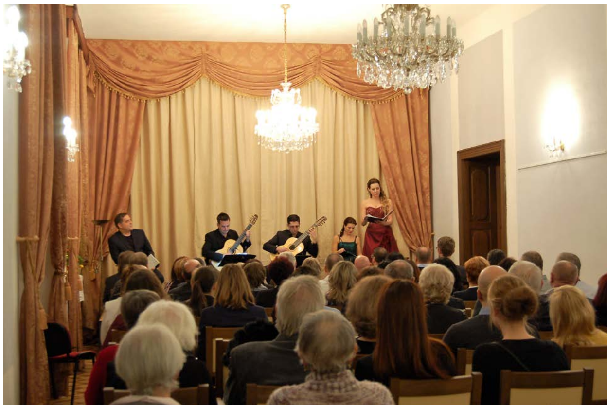
Obr. 20 Jako poděkování za úspěšnou spolupráci v roce 2017 připravilo muzeum pro své spolupracovníky a příznivce speciální adventní koncert v nově upraveném koncertním sále vlašimského zámku

pozn. 1) Návštěvnost přednášek a akcí, které muzeum v roce 2017 spolupřádalo ve spolupráci s jinými institucemi mimo prostory muzea, není muzeem vykazována.