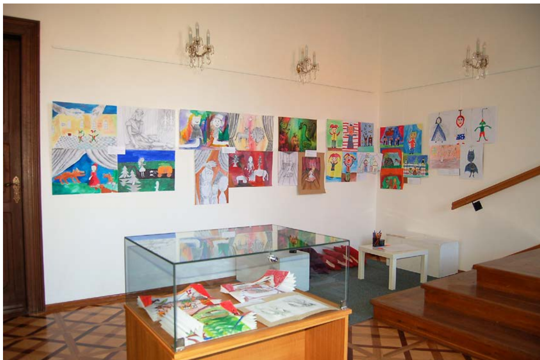
Obr. 10 Výstava dětských prací zaslaných do soutěže Malujeme s muzeem ve vlašimském zámku