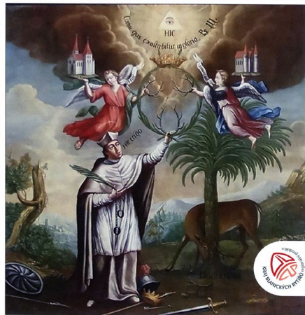
Výběz z restaurovaného obrazu „Blahoslavený Hieroným“ umístěného ve votivním klášteře (k článku na straně 29).

Vydává Podblanické ekocentrum ČSOP a Muzeum Podblanicka • Ročník XXV. (XLVII.) • č. 2 • 2021