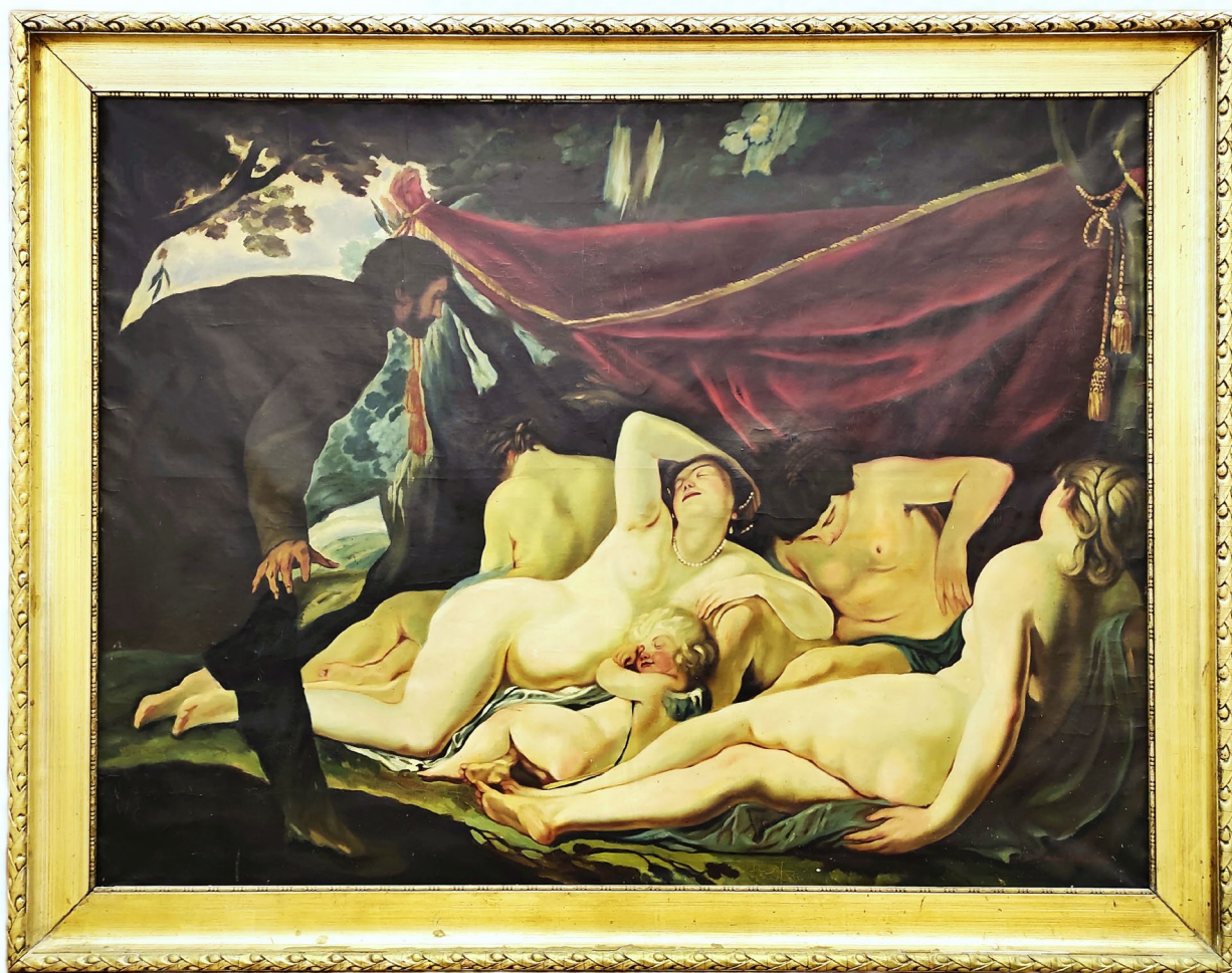
Obr. 2 Reprodukce obrazu Venuše s třemi gráciemi překvapenými Mortalem od Jacquese Blancharda je dalším z darů, které obohatily sbírky Muzea Podblanicka, p. o., v roce 2021 (foto J. Bouček)

Také v roce 2021 probíhalo jako nedílná součást muzejní práce péče o sbírkový fond muzea konzervování a restaurování vybraných sbírkových předmětů. Ve sledovaném roce bylo při přípravě muzejních výstav a úprav muzejních expozic pracovníky muzea konzervováno celkem 210 sbírkových předmětů, u kterých to vyžadoval jejich stav. Restaurovány pak byly dřevěný psací stůl s nástavcem v historizujícím slohu (konec 19. stol., inv. č. 22825 a 23049) a židle s čalouněným sedákem spojovaná s osobností skladatele Josefa Suka (počátek 20. stol., inv. č. 3953). Nejrozsáhlejším konzervačním zásahem pak byla odborná konzervace 724 kusů mincí vyražených na přelomu 16. a 17. století z depotu nalezeného u Maršovic (přir. č. 12/20).