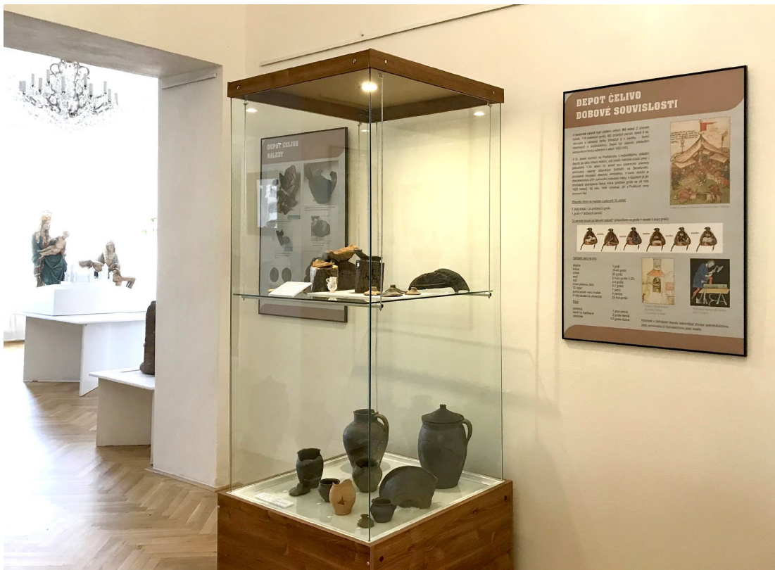
Obr. 7 Instalace výstavy Pod povrchem v domě čp. 74 v Benešově