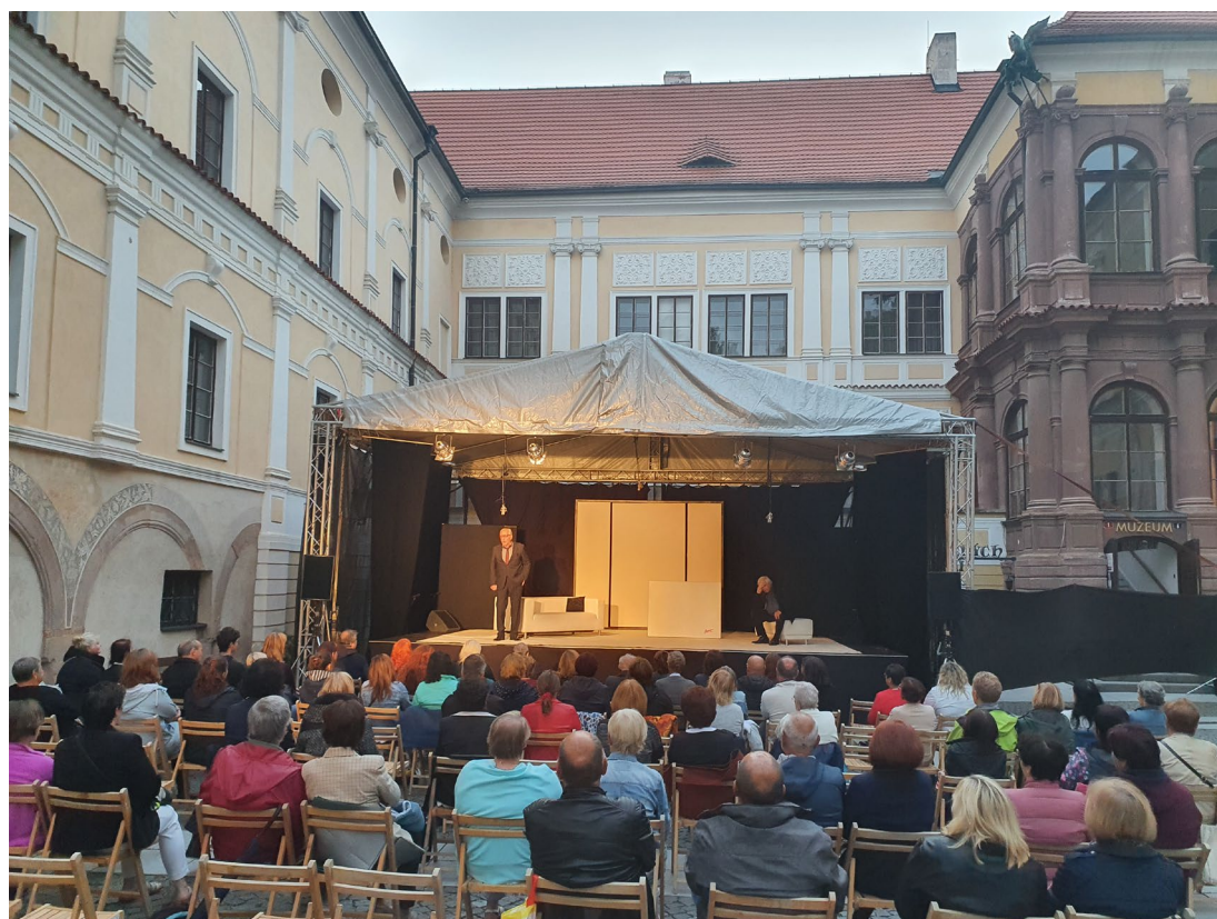
Obr. 12 Divadelní představení Art na nádvoří vlašimského zámku