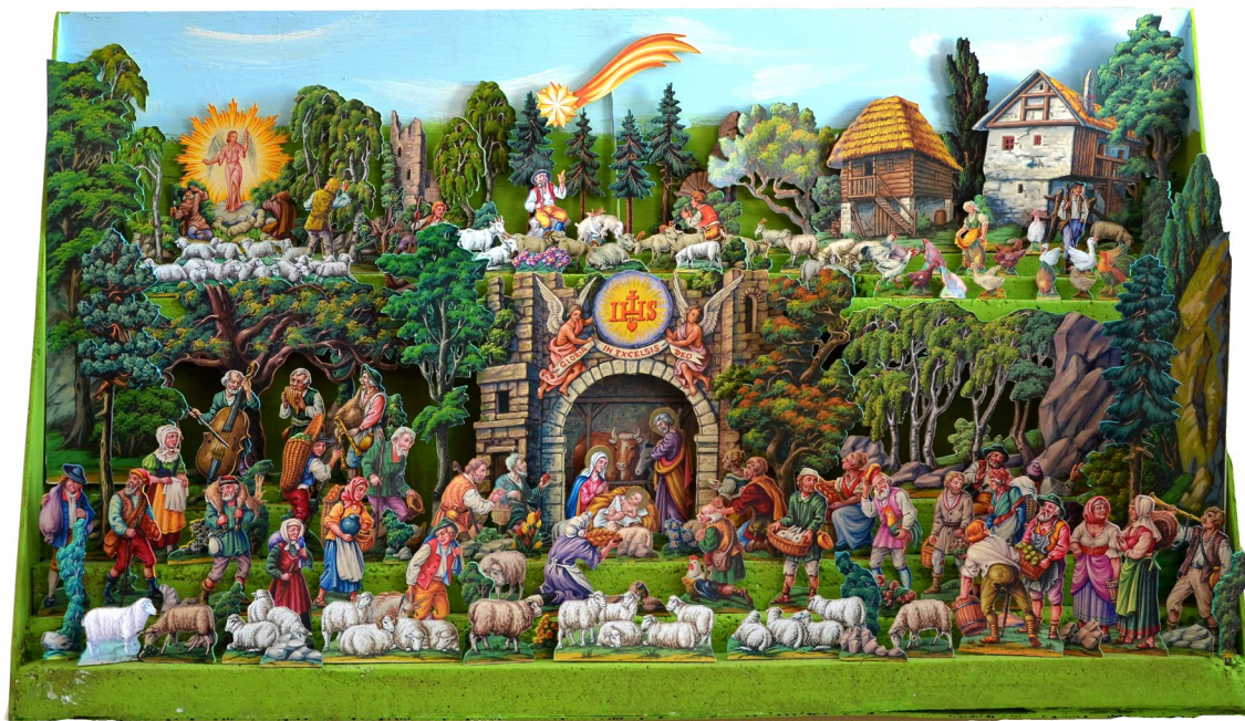
Obr. 1 Mezi dary, které v roce 2021 obohatily sbírky muzea, byla i tato replika papírového betlému z Ústí nad Orlicí

Rozšíření sbírkového fondu muzea proběhlo především prostřednictvím zápisu nálezů získaných v rámci záchranné archeologické činnosti, část pak prostřednictvím vlastní činnosti muzea, nákupů a darů do muzejních sbírek. Z celkového počtu nově získaných přírůstků připadlo 86 položek na dary, které věnovalo muzeu šest dárců.