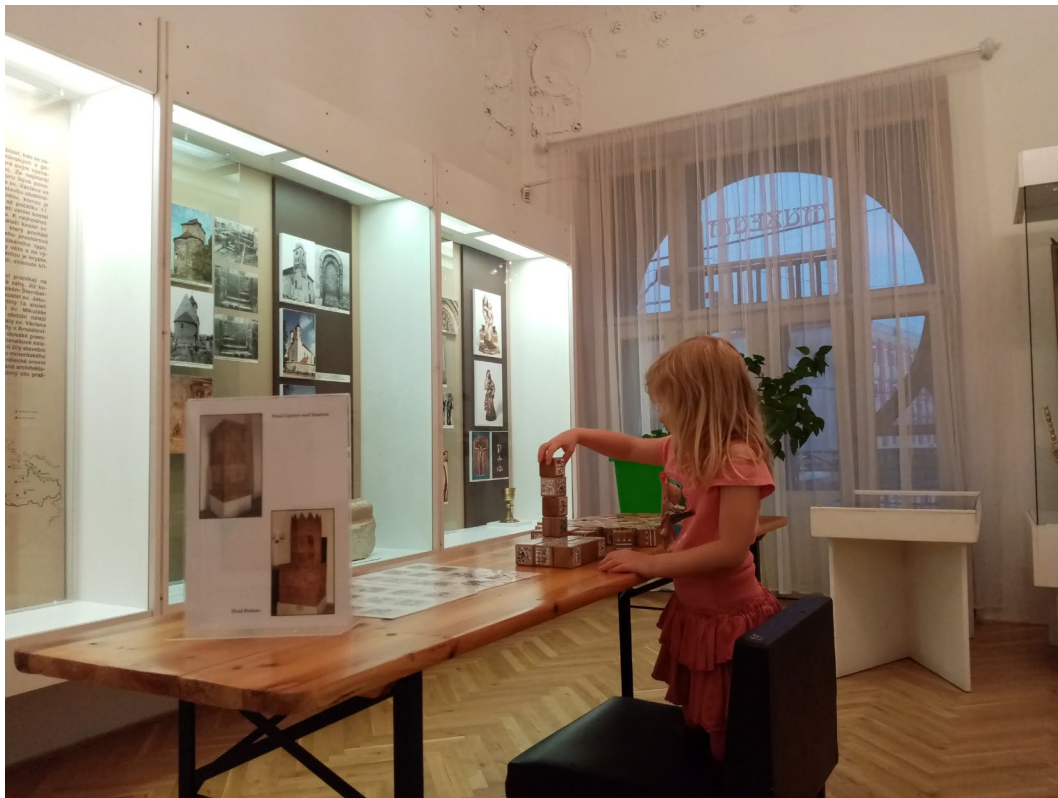
Obr. 18 Muzejní noc v domě čp. 74 v Benešově