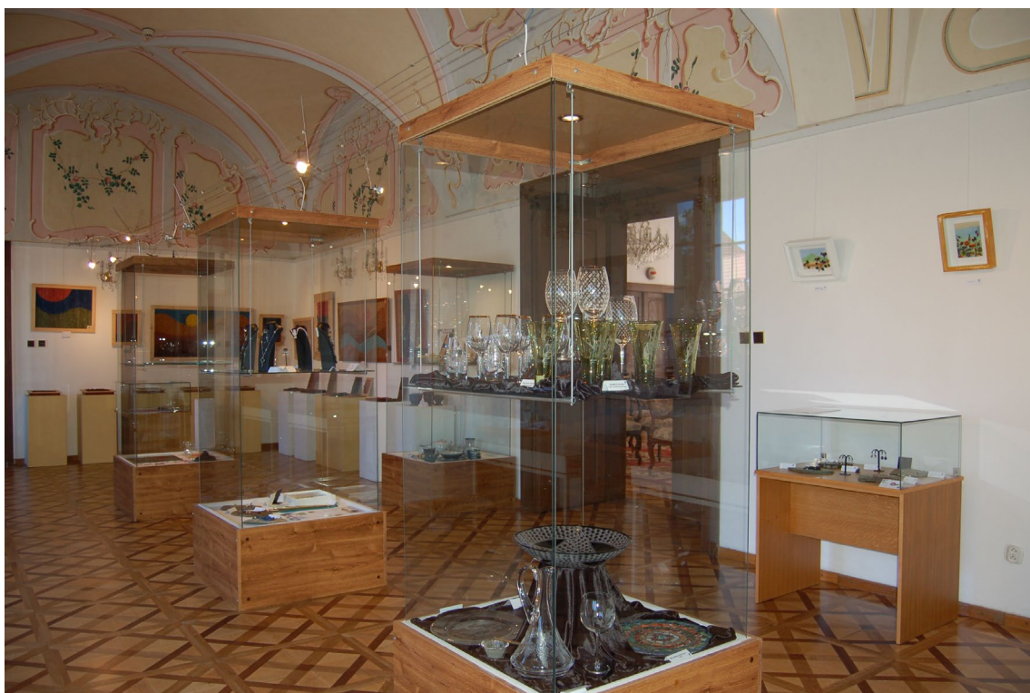
Obr. 6 Instalace výstavy Ta umí to a ten zas tohle ve vlašimském zámku