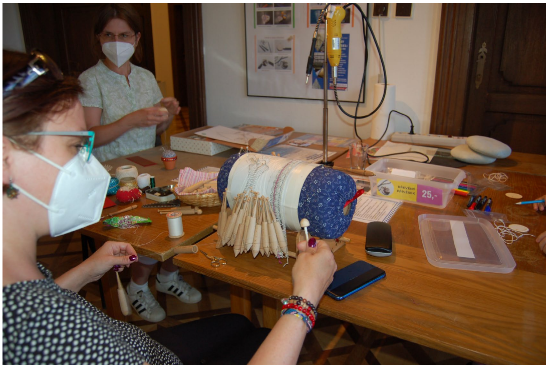
Obr. 14 Ukázka paličkování krajek v rámci výstavy Ta umí to a ten zas tohle