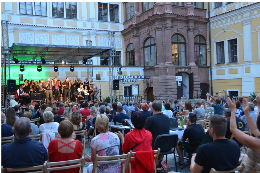
Obr. 13 Koncert Marika Singers na nádvoří vlašimského zámku