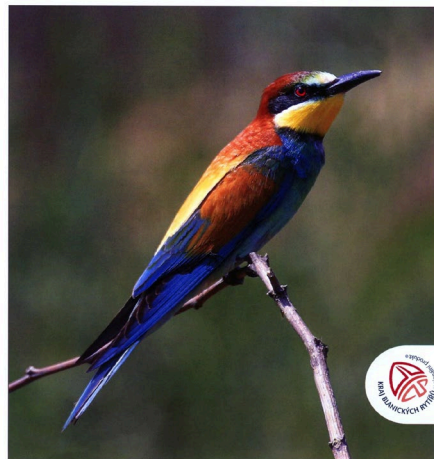
Vilha pestrá (foto: M. Ráček; k článku na straně 8).

Vydává Podblanické ekocentrum ČSOP a Muzeum Podblanicka • Ročník XXV. (XLVII.) • č. 3 • 2021