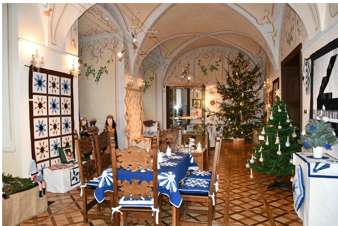
Obr. 10 Výstava Vánoce s patchworkem a Pražské Jezulátko v zámku ve Vlašimi