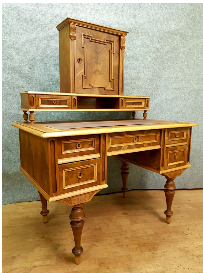
Obr. 3 Zrestaurovaný dřevěný psací stůl s nástavcem v historizujícím slohu (inv. č. 22825 a 23049)

Knihovna, fotoarchiv muzea a jednotliví odborní muzejní pracovníci ve sledovaném roce vykázali celkem 49 badatelských návštěv.