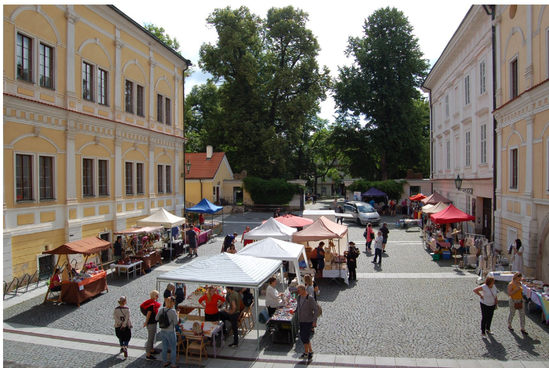
Obr. 15 Řemeslný jarmark ve Vlachovicích