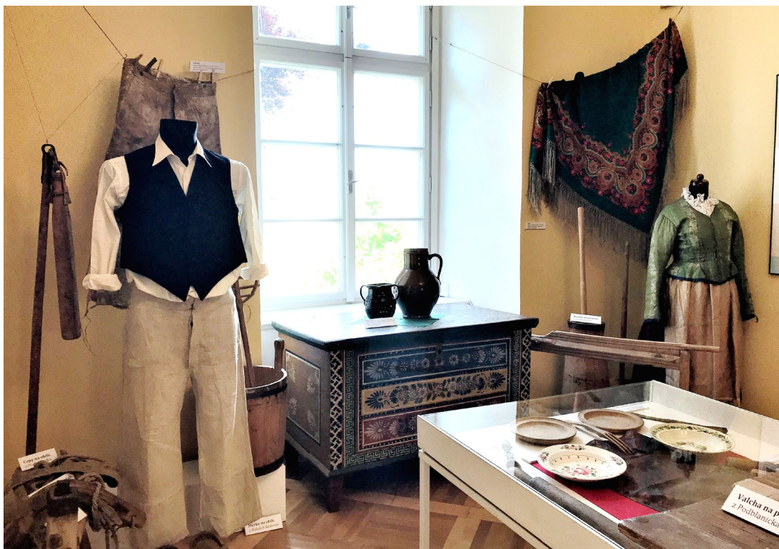
Obr. 8 Výstava V chalupách pod Bláníkem v zámku Růžkovy Lhotice