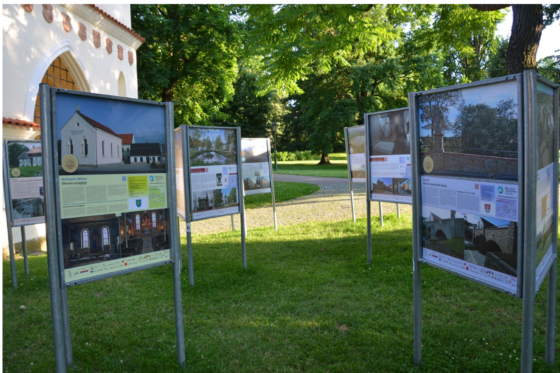
Obr. 9 Instalace výstavy Má vlast cestami proměn v zámeckém parku ve Vlašimi