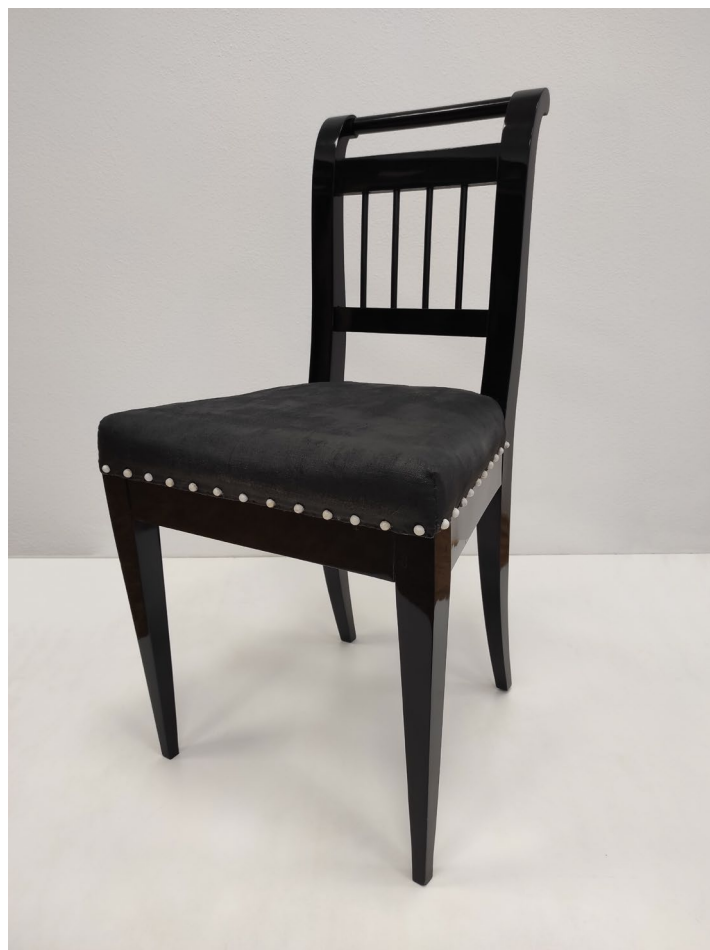
Obr. 4 Zrestaurovaná židle s čalouněným sedákem (inv. č. 3953)