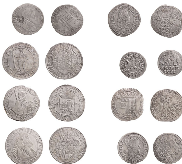
Obr. 5 Ukázka mincí z depotu z Maršovic po konzervaci