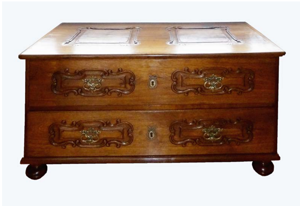
Obr. 4 Dřevěná komoda v historizujícím stylu (inv. 38940) ze sbírek muzea zrestaurovaná v roce 2015