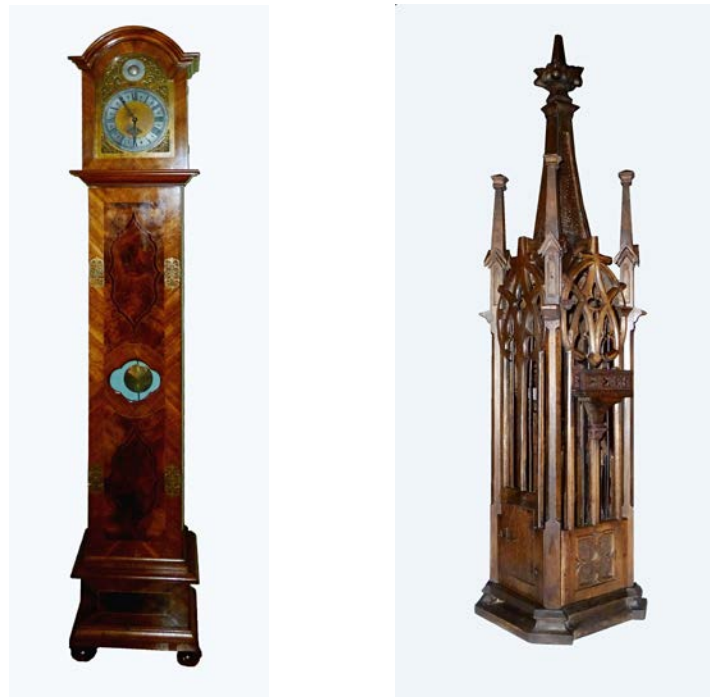
Obr. 2-3 Dřevěné intarzované sloupové hodiny (invc. 22610) a dřevěná ptačí klec v historizujícím stylu (invc. 2697) ze sbírek muzea zrestaurované v roce 2015

Knihovna a fotoarchiv muzea ve sledovaném roce vykázaly 133 badatelských návštěv.