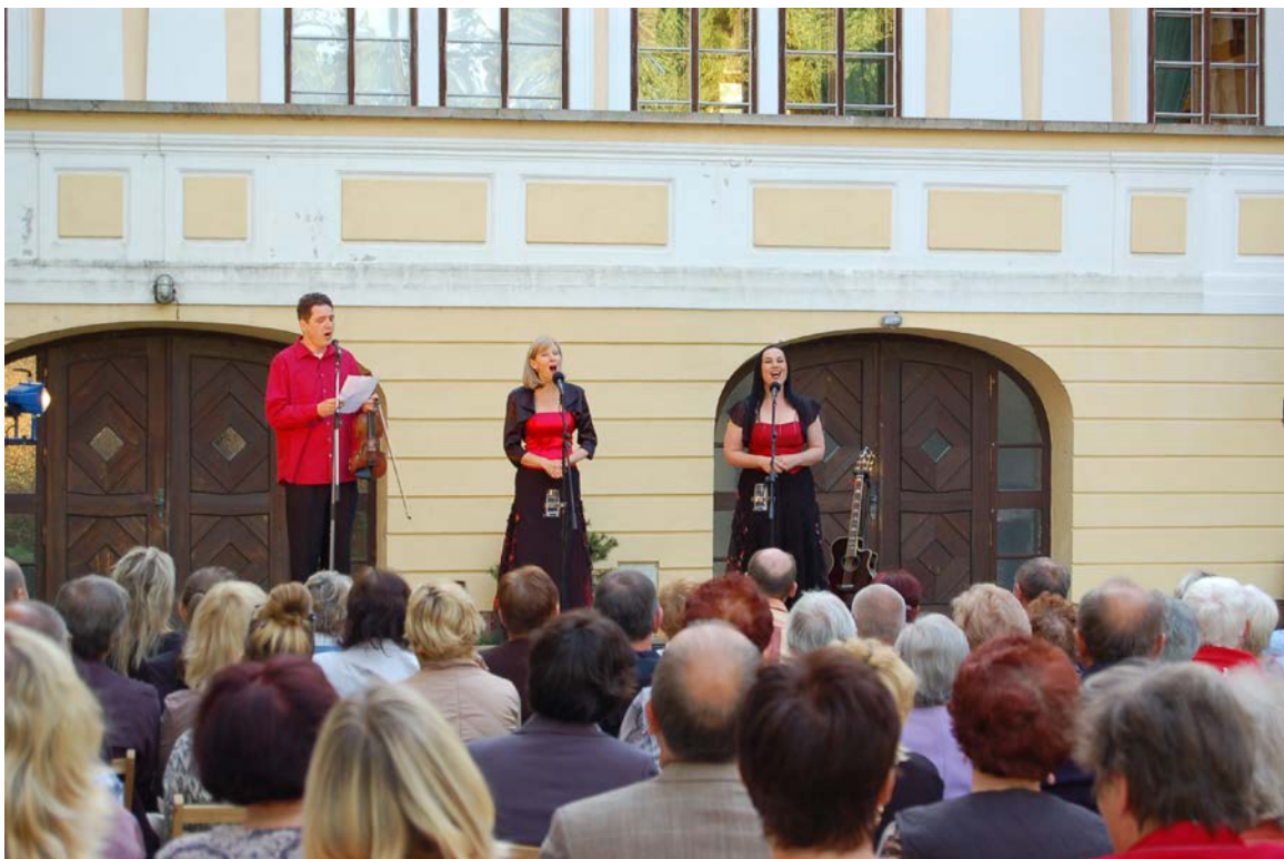
Obr. 11 Koncert dua Two voices na nádvoří vlašimského zámku

V rámci kulturně výchovné činnosti uspořádalo muzeum v roce 2015 celkem 115 akcí. Během pravidelné koncertní sezony Muzea Podblanicka, p. o., ve vlašimském zámku bylo v roce 2015 uspořádáno muzeem celkem 12 koncertů. Dále se muzeum také spolupodílelo na pořádání dalších 22 koncertů ve Vlašimi (viz Příloha č. 3). Posluchači měli příležitost v koncertním sále vlašimského zámku navštívit vystoupení celé řady známých ale i mladých začínajících umělců a předních hudebních těles, například Kateřiny Englichové, Václava Hudečka, dua Two voices či vítěze mezinárodní pěvecké soutěže Jakuba Pustiny a mnohých dalších.