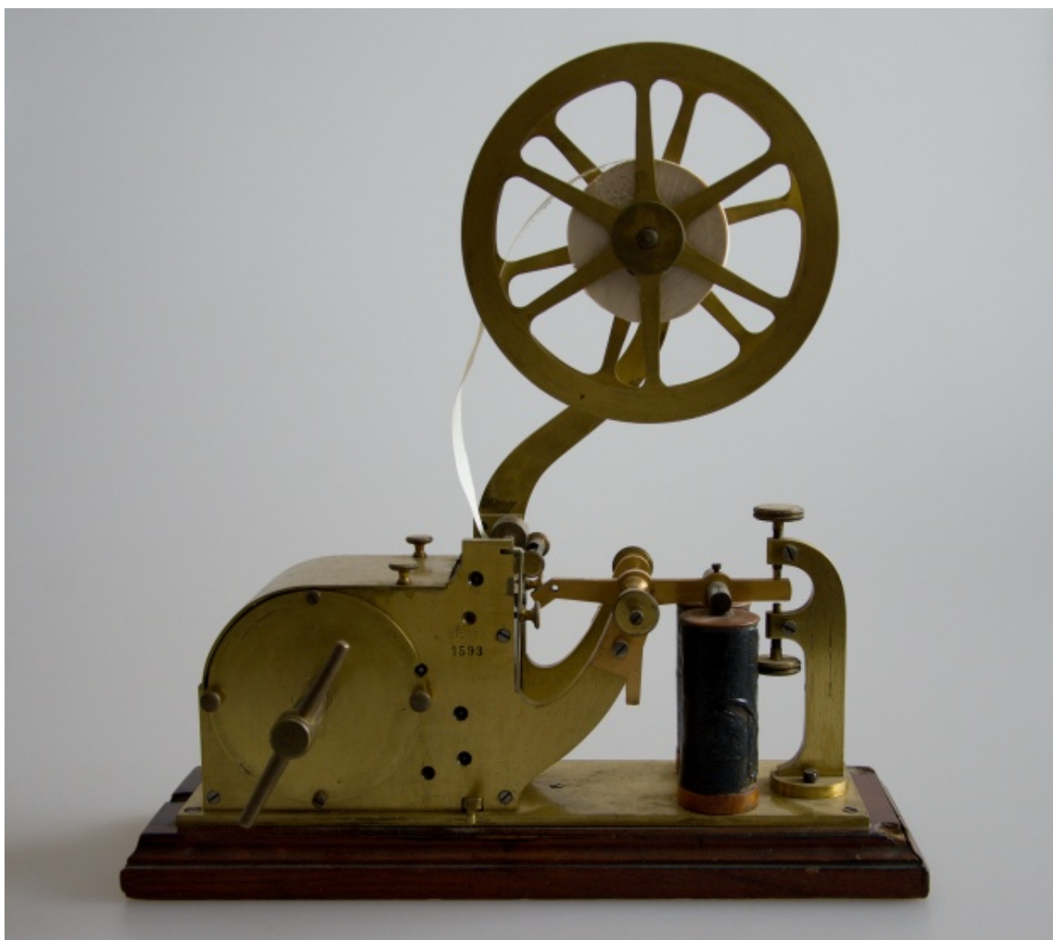
Obr. 1 Mezi sbírkovými předměty získanými darem byl například telegrafní přístroj z přelomu 19. a 20. století

Rozšíření sbírkového fondu muzea proběhlo především prostřednictvím nákupů, zápisu nálezů získaných v rámci záchranné archeologické činnosti a prostřednictvím darů do muzejních sbírek. Z celkového počtu nově získaných přírůstků připadlo 154 položek na dary, které věnovalo muzeu celkem 10 dárců.