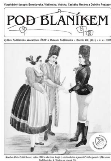
Obr. 17- 18 Obálky publikace Vlašimský velkostatek ve fotografii před 100 lety a dnes a 4. čísla 19. ročníku časopisu Pod Bláníkem