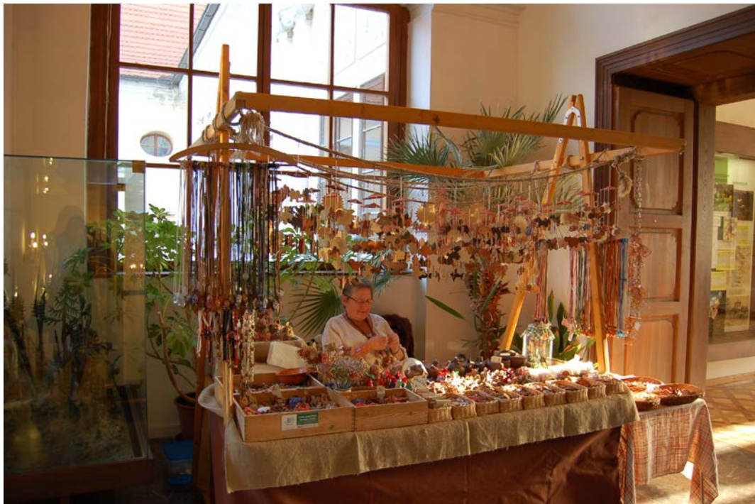
Obr. 13 Program v rámci vlašimské Zámecké muzejní noci