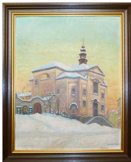
Obr. 1,2 Předměty zakoupené do sbírek Muzea Podblanicka v roce 2012 – pračka na ruční pohon a obraz F. Petridese