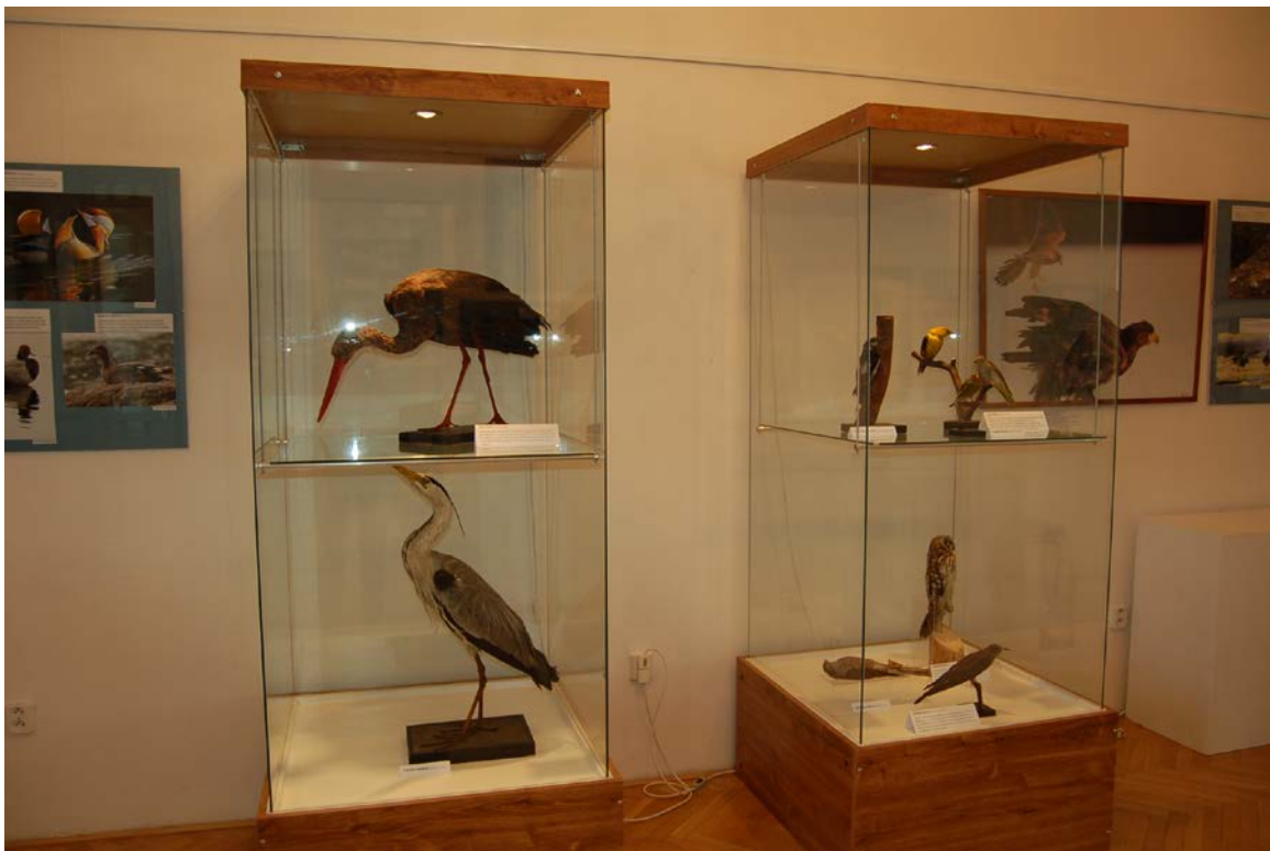
Obr. 12 Instalace výstavy Ptáci Podblanicka v pobočce Benešov