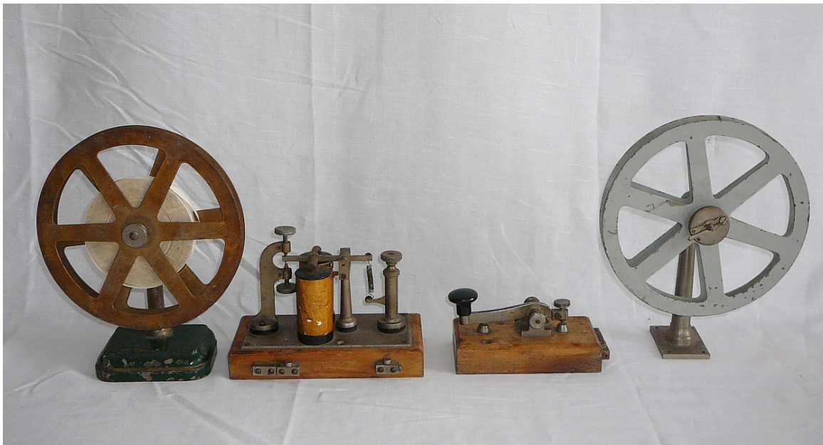
Obr. 3 Jedním z nových sbírkových předmětů získaných darem byl telegrafický přístroj (foto Muzeum Podblanicka)

Také v roce 2012 byla nedílnou součástí muzejní práce péče o sbírkový fond muzea. Ve sledovaném roce bylo při přípravě muzejních výstav a úprav muzejních expozic odborně konzervováno 118 sbírkových předmětů, u kterých to vyžadoval jejich stav. Na rozdíl od roku 2011, kdy to neumožnily finanční možnosti muzea, bylo ve sledovaném období opět přikročeno k postupnému restaurování sbírkových předmětů. Konkrétně bylo restaurováno celkem šest obrazů z muzejních sbírek: portrét Ferdinanda von Kuenburg (olej na plátně, nesignovaný, pravděpodobně ze 17. století, invc. 4559), portrét Balthasara von Kuenburg (olej na plátně, nesignovaný, pravděpodobně ze 17. století, invc. 4560), žánrový portrét císaře Josefa II. (olej na plátně, nesignovaný, pravděpodobně konec 18. století, 62 x 45 cm, invc. 1254), portrét mladého Josefa II. či Leopolda II. (olej na plátně, nesignovaný, pravděpodobně druhá polovina 18. století, 71 x 49,5 cm, invc. 1250), portrét Leopolda Hufnagela (olej na plátně, signovaný J. Trislik, 1894, 59 x 47 cm, invc. 13855) a manželky Leopolda Hufnagela (olej na plátně, signovaný J. Trislik, 1899, 59 x 47 cm, invc. 13856).