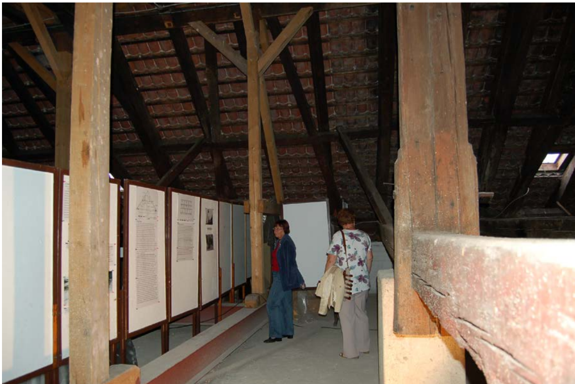
Obr. 15 Výstava prezentující dochovanou část barokního krovu vlašimského zámku v rámci Dnů evropského kulturního dědictví