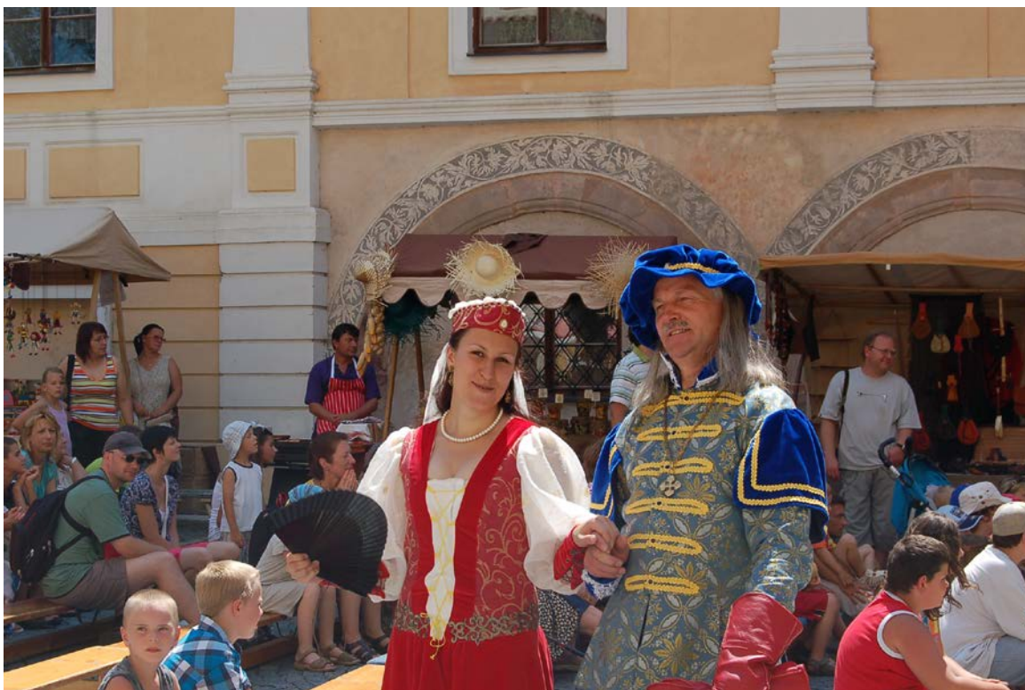
Obr. 14 Záběr z průběhu Vostroveckého slavení ve vlašimském zámku

Jako každoročně se Muzeum Podblanicka zapojilo také do pořádání nejrůznějších akcí nadregionálního a mezinárodního charakteru, jako jsou Mezinárodní den památek, Festival muzejních nocí, Dny evropského kulturního dědictví či Den Středočeského kraje. V rámci těchto akcí připravilo pro své návštěvníky celou řadu doprovodných akcí.