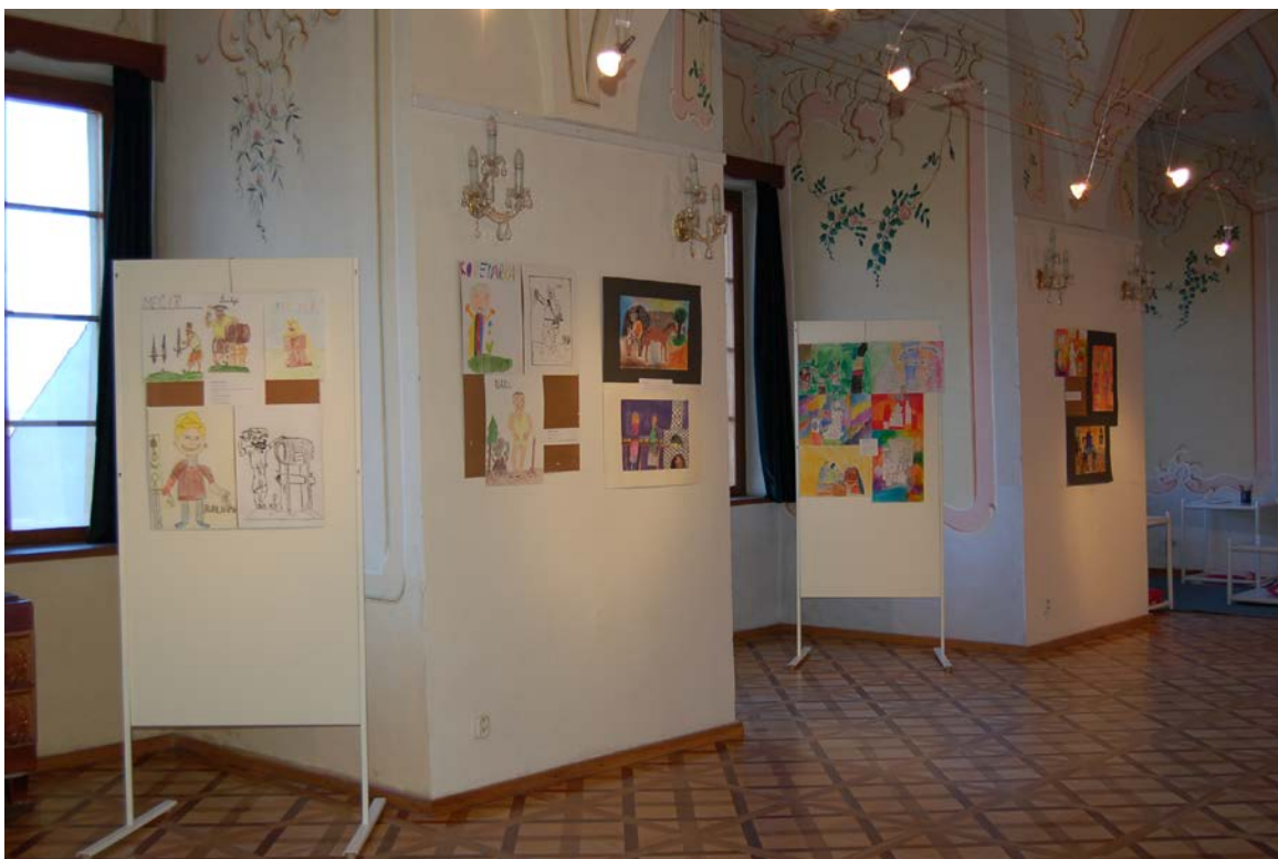
Obr. 16 Instalace prací přihlášených soutěže Malujeme s muzeem ve výstavních prostorách vlašimského zámku