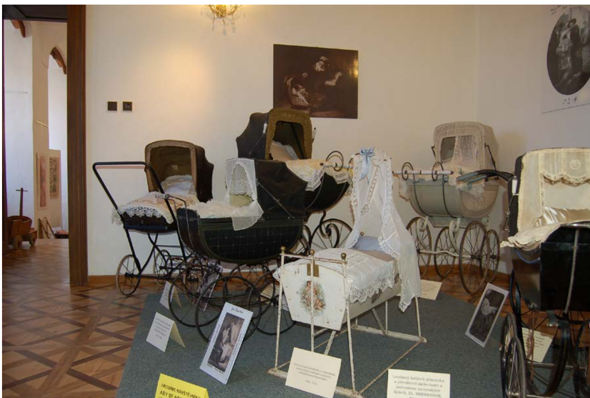
Obr. 10 Ukázky z instalace výstavy Historické kočárky a kolébky ve vlašimském zámku