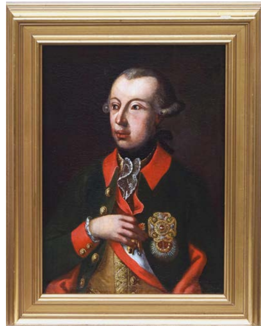
Obr. 6,7 Portréty Josefa II. (případně Leopolda II.) ze sbírek muzea zrestaurované v roce 2012 (foto Muzeum Podblanicka)