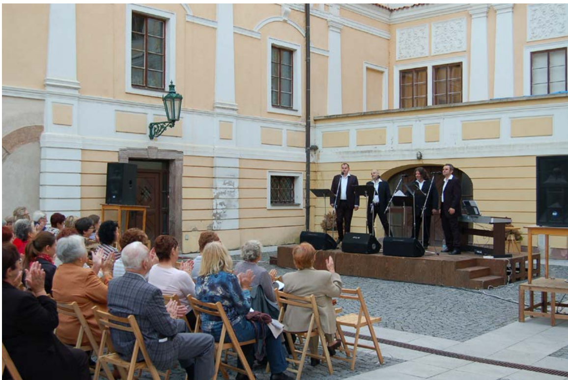
Obr. 13 Koncert pěveckého kvarteta Q VOX na nádvoří vlašimského zámku během VIII. muzejní noci

V rámci kulturně výchovné činnosti uspořádalo muzeum v roce 2012 celkem 77 akcí. Největší zájem veřejnosti se, jako již tradičně, soustředil na koncerty, které se konaly v rámci pravidelné koncertní sezony Muzea Podblanicka ve vlašimském zámku. V roce 2012 jich bylo celkem 10. Dále se muzeum spolupodílelo na pořádání dalších 13 koncertů ve Vlašimi a v Růžkových Lhoticích (viz Příloha č. 3). V rámci muzejní koncertní sezony vystoupila v koncertním sále vlašimského zámku celá řada známých ale i mladých začínajících umělců a předních hudebních těles (např. Apollon Quartet, Ensemble Martinů, Q VOX, atd.). Zahraniční umělce reprezentovaly dvě mladé hudebnice v rámci koncertu Japan Trumpet.