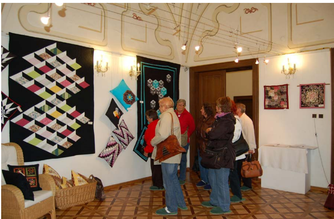
Obr. 11 Výstava Podblanický patchwork