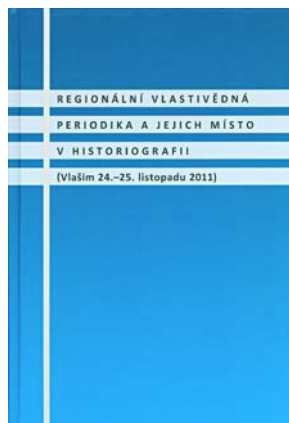
Obr. 20 Publikace Regionální vlastivědná periodika a jejich místo v historiografii

Nejvýraznějším edičním počinem muzea bylo v roce 2012 vydání publikace Regionální vlastivědná periodika a jejich místo v historiografii , a to ve spolupráci se Státním oblastním archivem v Praze a Státním okresním archivem v Benešově a za finanční podpory Středočeského kraje. Publikace navázala na konferenci, která se uskutečnila v Muzeu Podblanicka v roce 2011 a již se zúčastnili zájemci o problematiku regionálních periodik z celé České republiky a ze Slovenska. Publikace zahrnuje nejen většinu příspěvků, které na konferenci zazněly, ale i řadu dalších statí na dané téma.